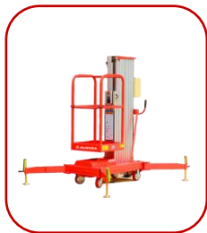
Мачтовый подъемник с выносными опорами