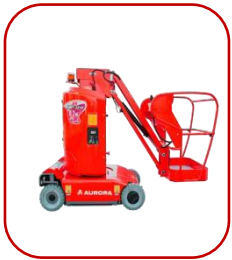
Самходный мачтовый подъемник