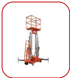
Несамходный двойной мачтовый подъемник